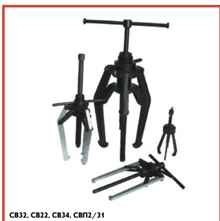
СВ32, СВ22, СВ34, СВП2/31

Предназначены для демонтажа деталей, установленных с натягом, когда для снятия деталей требуются незначительные усилия;