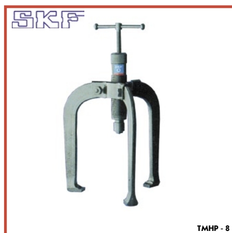
TMRP - 8